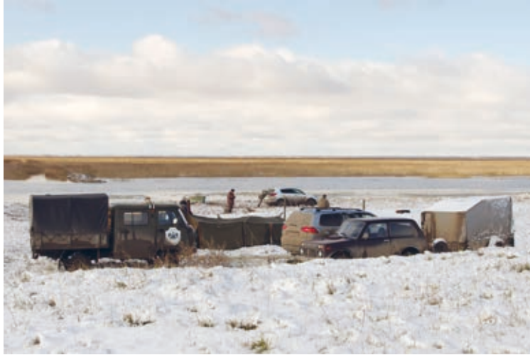
Vesilintumetsästäjien leiri Tyumenin alueella (lokakuu 2016).

Wildfowler's camp in Tyumen Region (October 2016).