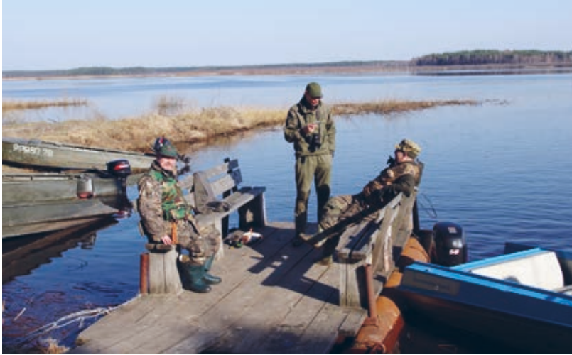
Metsästäjien haastattelu (Ryazan, huhtikuu 2013).

Interviewing hunters (Ryazan Region, April 2013).