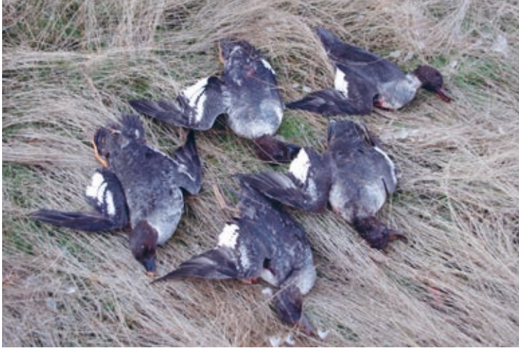
Telkät ovat suosittu saalislaji läntisessä Siperiassa (Kurgan, lokakuu 2015).

Goldeneyes are favourite hunting bag in Western Siberia (Kurgan Region, October 2015).